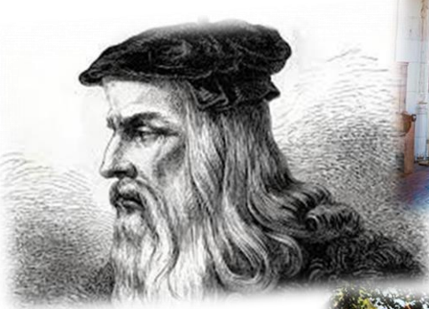
Figure 6 : Léonard de Vinci