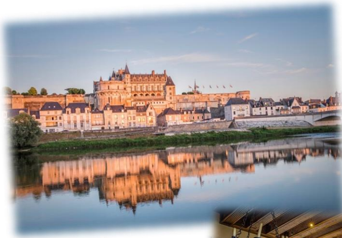
Figure 5 : château d'amboise

C'est l'un des préférés des rois de France mais sa taille a depuis été réduite et remplacée par des jardins de style méditerranéens dans lesquels il est agréable de se balader. Depuis les terrasses, vous profiterez d'une vue imprenable sur le Val de Loire. Léonard de Vinci y passera ses trois dernières années. La chapelle Saint Hubert y abrite sa sépulture. La demeure de Léonard de Vinci est visitable, il s'agit de la résidence du Clos Lucé, dans le centre-ville d'Amboise, appelée autrefois le manoir du Cloux.