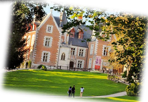
Figure 7 : Résidence du Clos Lucé (Amboise)