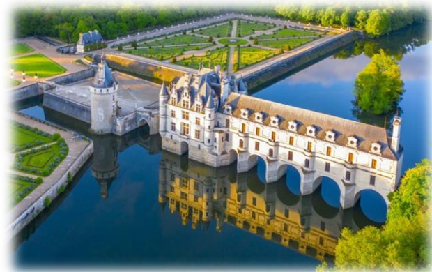
Figure 4 : Château de Chenonceau

Classé monument historique depuis 1962, il a la particularité d'enjamber le Cher. Il fut bâti et décoré exclusivement par des femmes, d'où son surnom de Château des Dames. C'est sans doute l'un des plus imposants des châteaux de la Loire. C'est également le seul à disposer d'un atelier floral où sont composés de magnifiques bouquets placés à l'intérieur du château. On tombe également sous le charme indéniable des jardins.