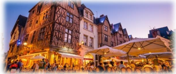
Figure 2 : Place Plumereau Tours.

Surnommée la ville Blanche et Bleu à cause de l'enduit à la craie des façades de ses maisons et des tuiles en ardoise, Tours est le chef-lieu du département de l'Indre-et-Loire.