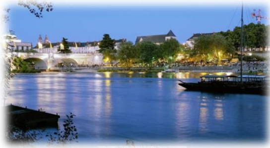
Figure 1 : Tours

Surnommée la ville Blanche et Bleu à cause de l'enduit à la craie des façades de ses maisons et des tuiles en ardoise, Tours est le chef-lieu du département de l'Indre-et-Loire.