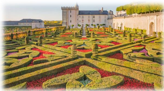
Figure 3 : Château de Villandry et ses jardins

Et quoi de mieux qu'une visite des châteaux pendant votre séjour en Indre-et-Loire ? C'est une activité à la fois culturelle, ludique et vivante qui s'adresse à toute la famille.