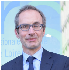
Laurent Habert, directeur général de l'ARS Centre-Val de Loire

Confrontés aux problématiques de démographie médicale, d'accès aux soins et de vieillissement de la population sur une large partie du territoire régional, les acteurs locaux et partenaires de l'ARS Centre-Val de Loire se sont pleinement mobilisés autour du volet investissement du Ségur de la santé pour réfléchir aux projets à même d'apporter des réponses concrètes au bénéfice de la population.